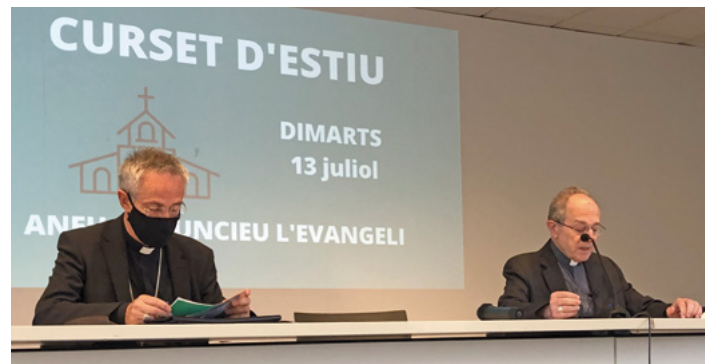
Ponència del bisbe Agustí Cortés

La ponència del bisbe Agustí va tenir lloc el primer dia, emmarcant el conjunt de les sessions posteriors, i la de Mn. Daniel Palau es va centrar en l'àmbit de l'evangelització a la parròquia.